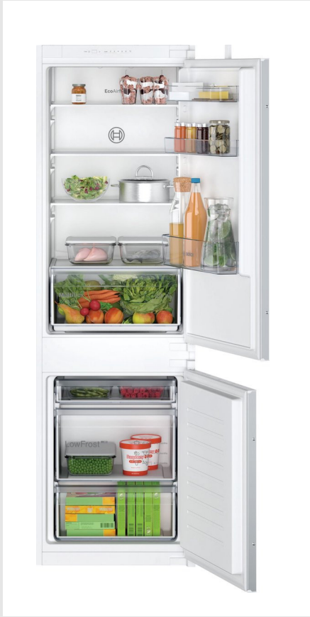
Koel/vriescombinatie Inhoud 183/84 liter, LED verlichting, glazen legplateaus