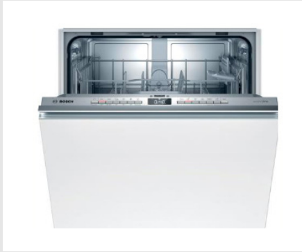
Vaatwasser Volledig geïntegreerd, geschikt voor 12 couverts, starttijdkeuze