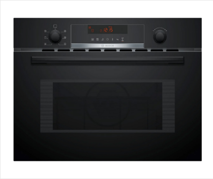
Combi-oven Inhoud 44 liter, LCD display, Cleaning Assistancefunctie, snel verwarmen