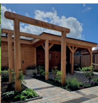
Pergola met klimop