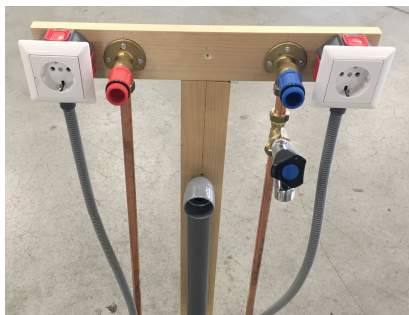
Afbeelding toont de gewenste ordelijke installatiewijze van het leidingwerk (let op: het benodigde leidingwerk is situatieafhankelijk)

Denkt u, indien van toepassing, ook aan plafondvoorzieningen voor afzuigkap (zie plafondplan).